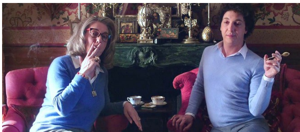
Capture d'écran de l'adaptation cinématographique de « Guillaume et les garçons à table ».