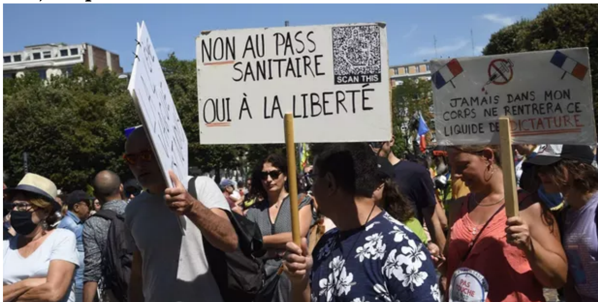
Manifestation à Lille contre le passe-sanitaire